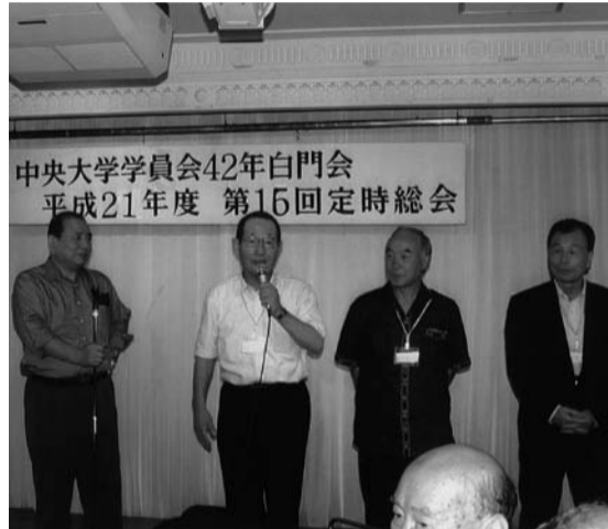
体育会の4人の代表が近況を語る