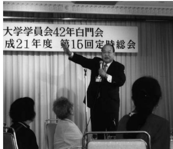
大木田会長のあいさつ