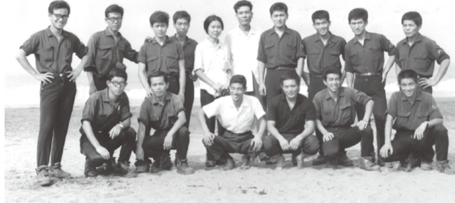
昭和41年千葉県房総半島岩井海岸での登山靴への感謝祭(ヒブラム祭と称していた)にて

合格後、いくつかの監査事務所から入所勧誘があつたが、海外関係の仕事に関心があつた。語の勉強ができる外資系のプライス・ウォーターハウスのP.W.現あらた監査法人(会計事務所)を選んだ。当時、日本企業は海外、特に米国で資金調達するた