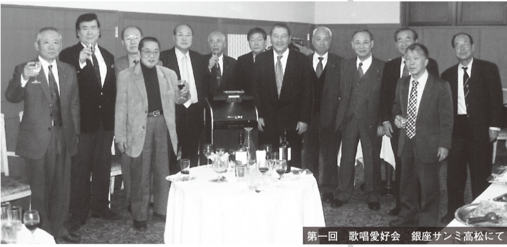
第一回 歌唱愛好会 銀座サンミ高松にて

一興商榷のものらしい。第一興商の機器はDAAMとよんでいる。私も、あまり艶歌や歌謡曲には興味が無かったが、諸会の二次会や飲み会で、カラオケの場所に連れて行かれた。そこで、演歌が歌いたら歌える様な歌でないと「ヒットしない」と言われていたらしい。