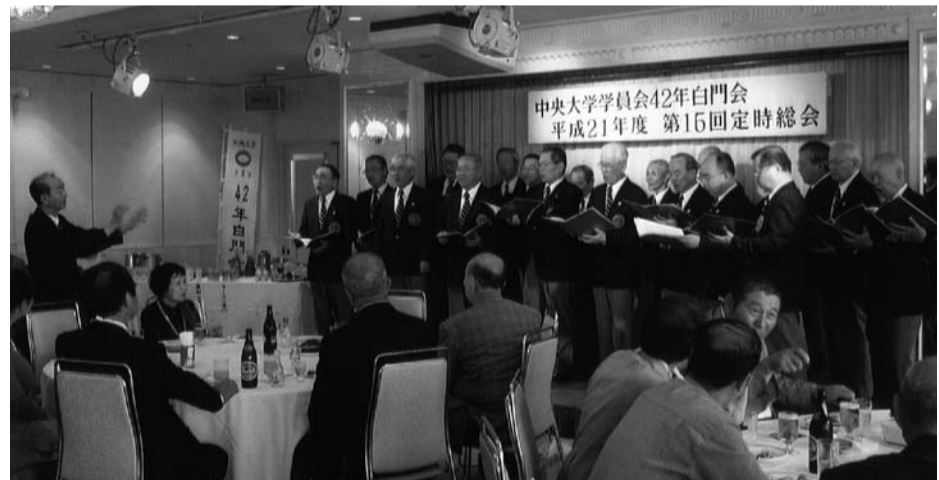
白門グリー クラブの合唱を楽しむ