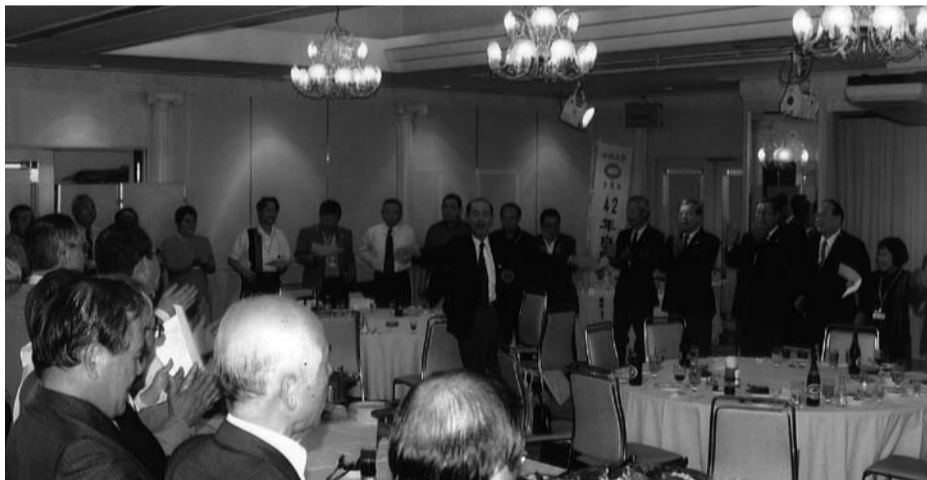
全員が輪になって校歌をうたう