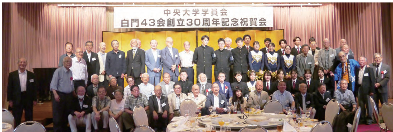
中大応援団の学生たちも交えてパチリ！