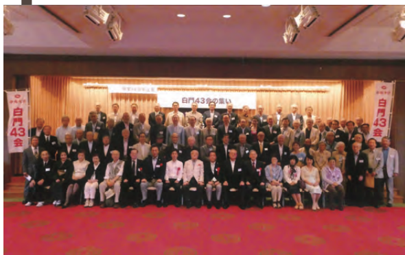
上野精養軒にて2018年7月6日、卒業50周年記念および第24回目となる定時総会を開催。