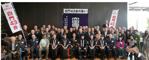
左：2023年、右：2024年。毎年恒例の「新春の集い」。2023年は2月24日に東天紅上野本店で、2024年は1月19日に初めて駿河台キャンパス19Fの「Good View Dining」で開催しました。