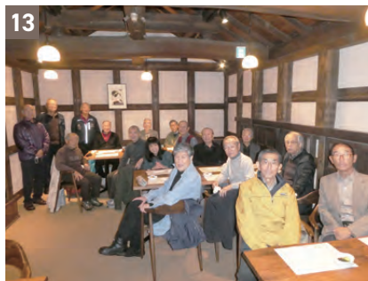
⑧⑨旅行会 岡山・香川(2019年4月23～25日) (⑧:岡山城、⑨:松林寺) ⑩ミニトリップ 栗田美術館・足利フラワーパーク(2019年5月8日) ⑪旅行会 酒田・鶴岡(2020年10月26～28日) ⑫ミニトリップ 葛飾柴又散策会(2022年11月1日) ⑬ミニトリップ 小江戸川越散策(2023年11月17日)