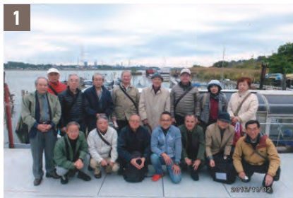
①ミニトリップ 我孫子・手賀沼(2016年11月2日) ②お花見会 市川市国府台(2017年4月7日) ③散歩と寄席の会 白金台・目黒ほか(2017年9月20日) ④旅行会 尾張・伊勢・志摩(2017年10月30日～11月1日) ⑤⑥⑦クルーズ旅行 ダイヤモンド・プリンセス号<横浜-釜山-四日市-横浜>(2018年10月31日～11月5日)

白門43会はこれまでにたくさんさんの旅行やミニトリップを企画し、開催してきました。思い出すのは、すばらしい景色や仲間との楽しい時間。その一部を写真で振り返ります。