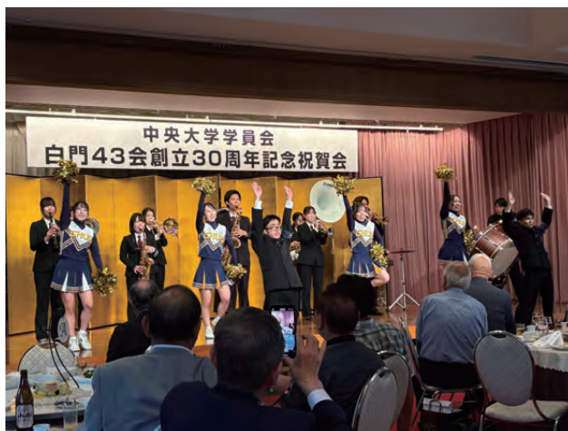
中大応援団の演舞

各テーブルで記念撮影。 多くのご来賓や参加者たちと 大いに語らい、 楽しんだ1日となりました。