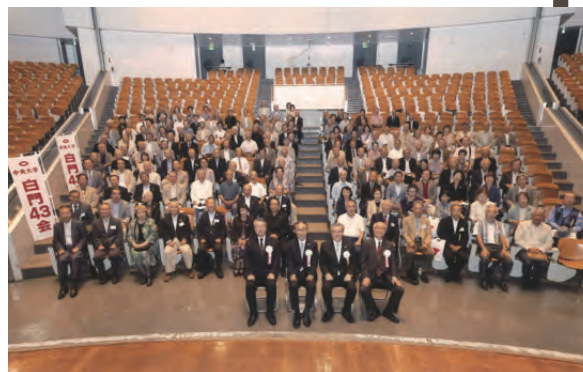
2018年10月7日、卒業50周年を迎える記念すべき年として、母校・中央大学より第27回ホームカミングデー・学員懇親会に招待いただきました。