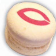
デザートにはCマーク入りマカロンが!