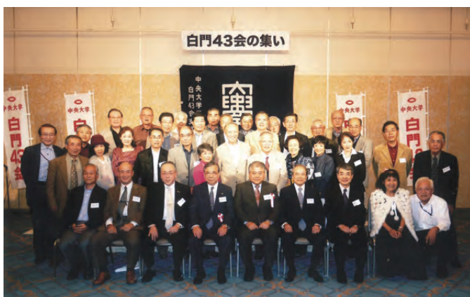
北海道の集い(2010年9月)

1997年11月 大阪の集い(大阪市) 1998年11月 東海の集い(名古屋市) 2000年9月 東北の集い(仙台市) 2002年10月 中国地区の集い(広島市) 2005年10月 新潟の集い (新潟市、村上市、佐渡) 2008年10月 福岡の集い (福岡市、熊本・黒川温泉) 2010年9月 北海道の集い(札幌市)