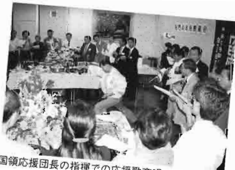
国領応援団長の指揮での応援歌斉唱