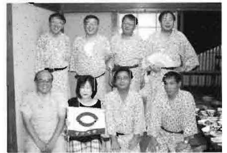
発足を宣言したニュービジネス研究会

浜急行三崎口駅に5名が集合、風力発電施設の見学、剣崎、城ヶ島、油壺マリーナ等観光・撮影のスポットを回り、当日の宿泊場所へと向かいました。京急油壺マリーナの夕日とシルエツトになったヨットは素晴らしいものであったことを報告させていただきます。