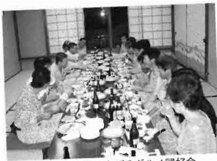
鯖づくしに盛り上がるグルメ同好会

朝食後は流れ解散となり、今回の合宿は終了しましたが、参加された方々には実りあるものであったようです。今後の各同好会活動が活発になることを祈念して、合宿の報告とさせていただきます。(文責||森雅明)