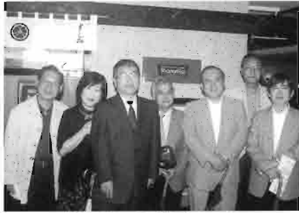
第2回集いの参加者（一部）

「東急ゴールデンホール」において白門48会の「地方行政」の第2回集いが開催されました。