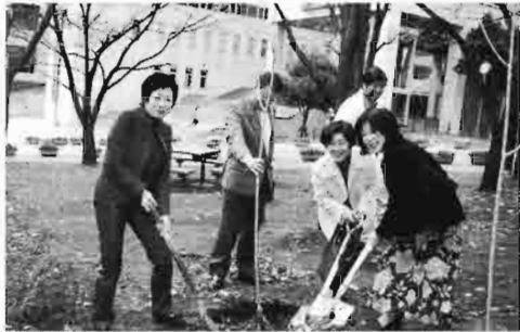
女性陣もスコップを手に植樹の儀式を