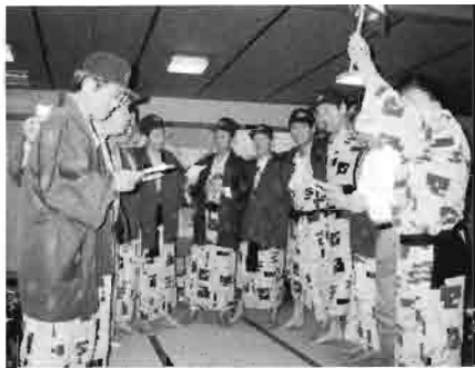
宴会では校歌・応援歌の大合唱