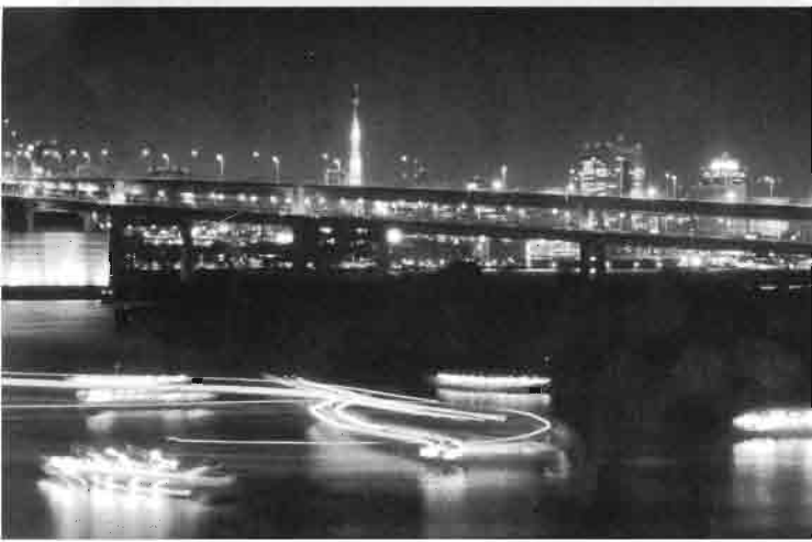
屋形船の航跡

天気は上々。風もほとんどない。このところの寒さがうそのように暖かい。最高の撮影日和になるぞ、と参加の会員は気持ちも軽い。撮影ポイントは夜のお台場。ターゲットには事欠か