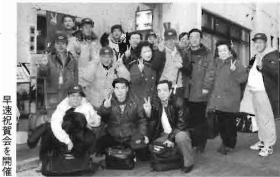
早速祝賀会を開催