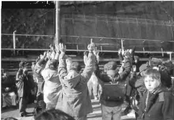
箱根湯本駅前で勝利の万歳三唱