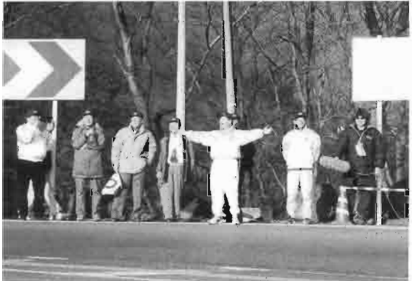
国領応援団長の力強いエール