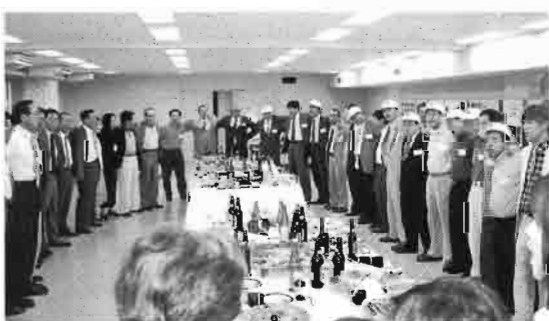
肩を組んでの校歌斉唱