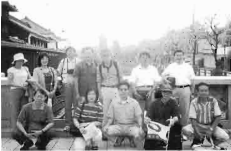
蔵と川をバックに参加者一同

日(土)朝 9時新宿 駅西口ス バルビル 前からレ ンタルし たマイク ロバスで 出発した。