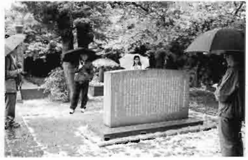
谷中霊園で慶喜公の墓所を見学する会員

を見学する。音羽の鳩山御殿の立派さに比してずいぶんと庶民的なお墓に一同びっくりする。「鳩山一郎」のお墓に並んでいる「横山大観」のお墓も、大観の名声からは考えられないごく普通のお墓だった。