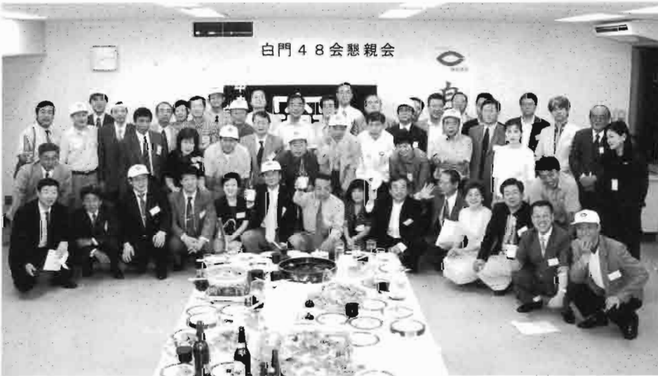
今年もこれだけの仲間が集まりました

01年6月9日(土) 3時30分から、中央大学の都心新拠点である市ヶ谷キャンパスで、白門48会の第3回総会・懇親会が開催されました。