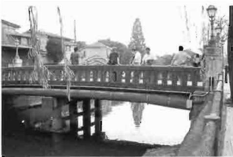
川ペりを散策する会員たち

日(土)朝 9時新宿 駅西口ス バルビル 前からレ ンタルし たマイク ロバスで 出発した。