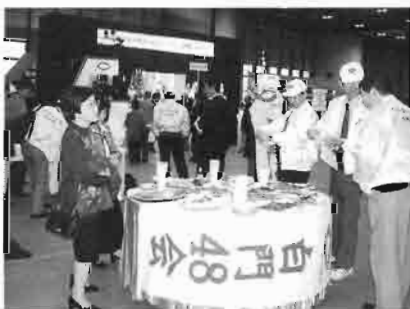
白門48会の専用テーブル