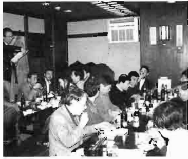
幹事会を兼ねた新年会

新年会は定例幹事会の日に行われ、議事は乾杯の前に報告のみ。親睦と二〇〇二年の計画の話で盛り上がっていました。