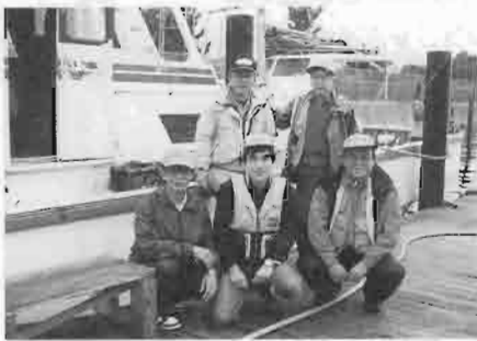
鯰釣りの参加者たち（金沢・鴨下丸）