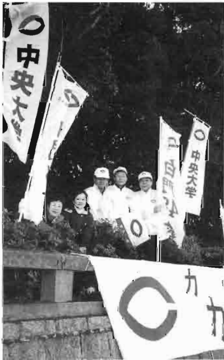
セッティングして万全の体制