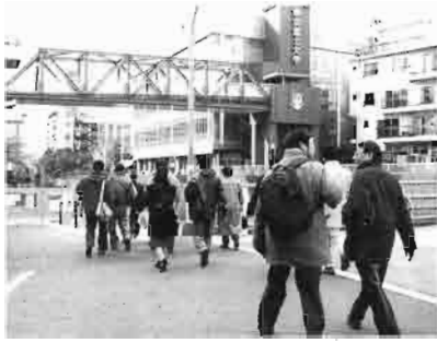
神田川沿いを歩く参加者たち

高田馬場駅前を二時一五分に出発。神田川沿いに歩く。錯覚を覚えるような袋小路を進むとそこが第一の目的地染物工場。