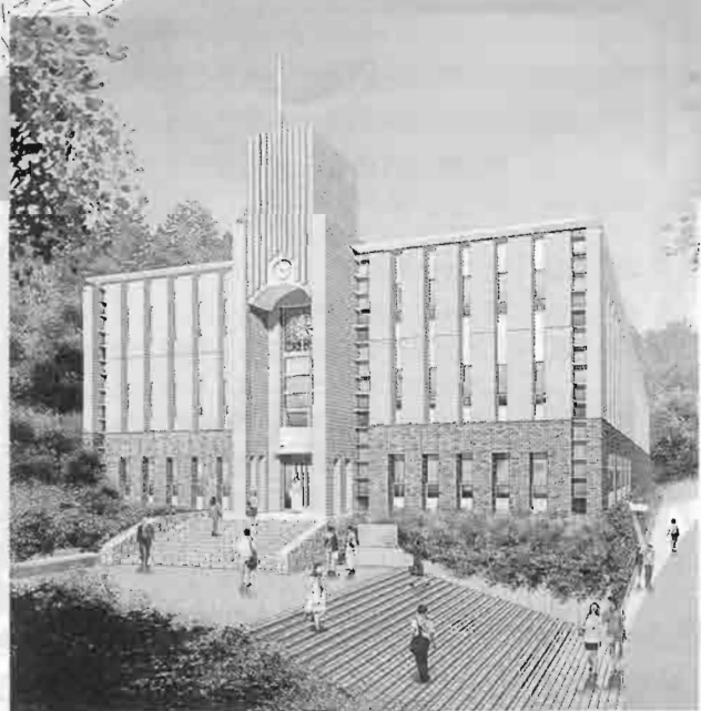
建設が予定される多摩学生研究棟「炎の塔」