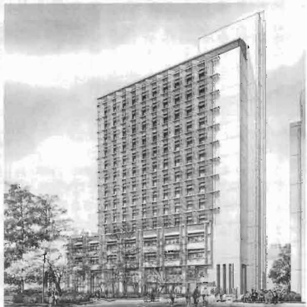
プロジェクトのひとつ後楽園キャンパス新棟（仮称）