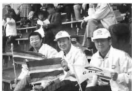
スタンドでは小旗を持って応援

この季節、各競技において秋季リーグ戦等々が行われていますが、日・月曜日の新聞朝刊スポーツ欄を注目してみいてく