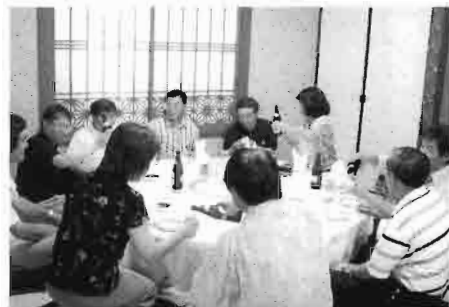
円卓を囲みまずは乾杯

そのいい気分のまま、徒歩で元町を横切り目的地の中華街のほぼ中央「重慶飯店本店」に向かい、本場の四川料理を堪能することにしました。重慶飯店で