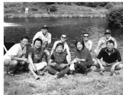
バーベキューの後、水辺で憩う

食後は釣場のほとりで水に浸かり、一時の休憩。子供時代なら体中水に浸かりたいところ。川遊びができなかったのは残念でしたが、緑の山の中のバーベキューは、たいへん楽しいものでした。