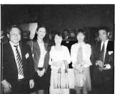
留学生たちと記念撮影

第一部は「日本の伝統文化の理解のために」というサブタイトルのもと、歌舞伎観賞教室に参加した。公演は、平家女護鳥と俊寛という、平家物語の「俊