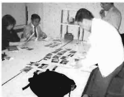
写真を広げて相互批評をする会員

写真同好会はヤドカリのようなものです。他同好会の企画の尻馬に乗り、ついていって写真だけ撮る。これが今年の基本方針。でも、撮るだけでは進歩が