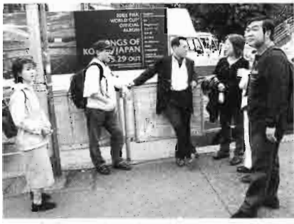
原宿駅前にたむろする参加者たち

の予定でしたが、急な呼びかけで人が集まらず残念。またの企画と多くの参加を期待し、紀行とします。