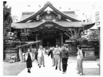
湯島天神境内を散策する参加者たち