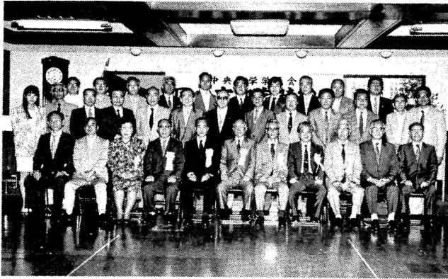
平成2年度 中央大学学員会 国立支部定時総会 平成2年5月27日