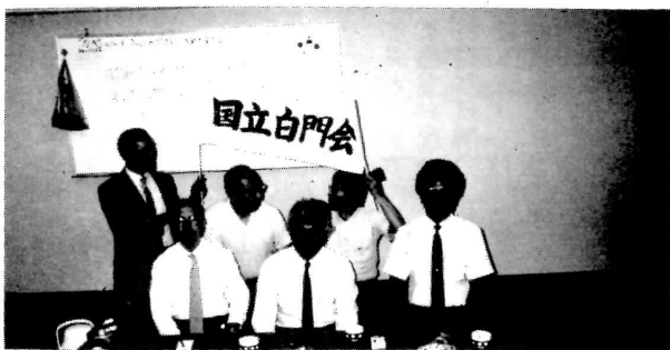
あれこれ考える会